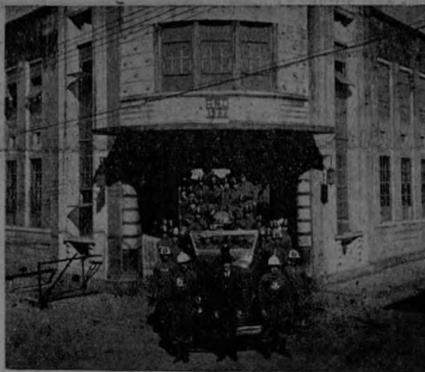
Bomberos saliendo de la Estación Central

Se celebraron el domingo las terceras competencias de bomberos voluntarios, compitiendo por el trofeo "Luis Demetrio Tinoco Gutiérrez", uno de los fundadores de ese importante cuerpo.